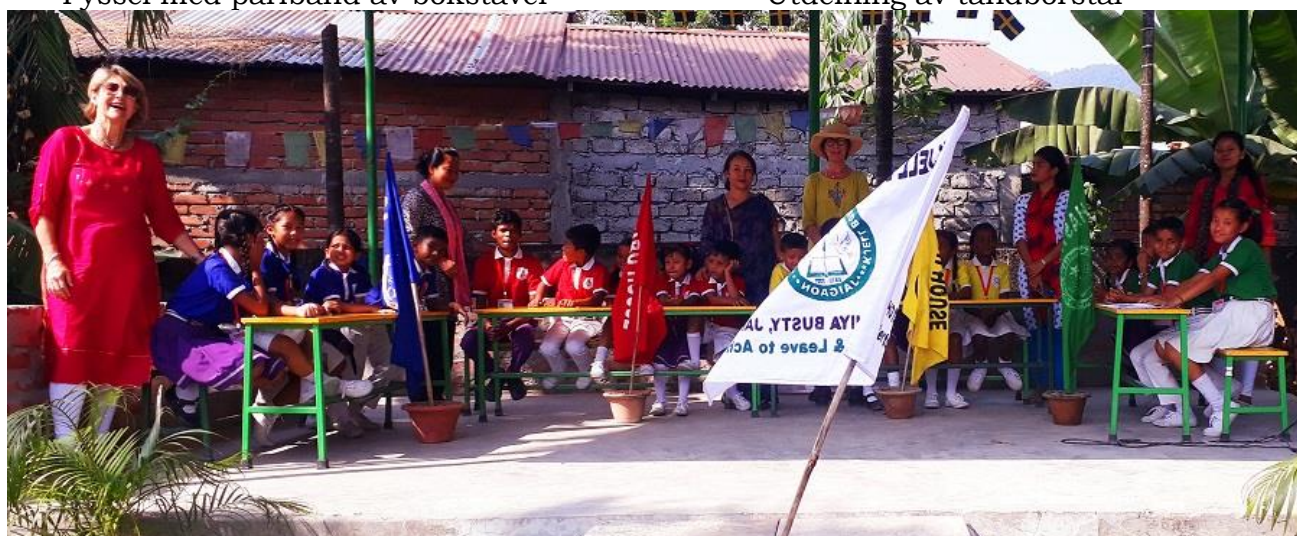
Skol-quiz mellan olika lag på skolan