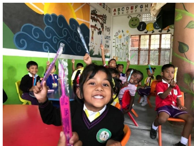
Utdelning av tandborstar