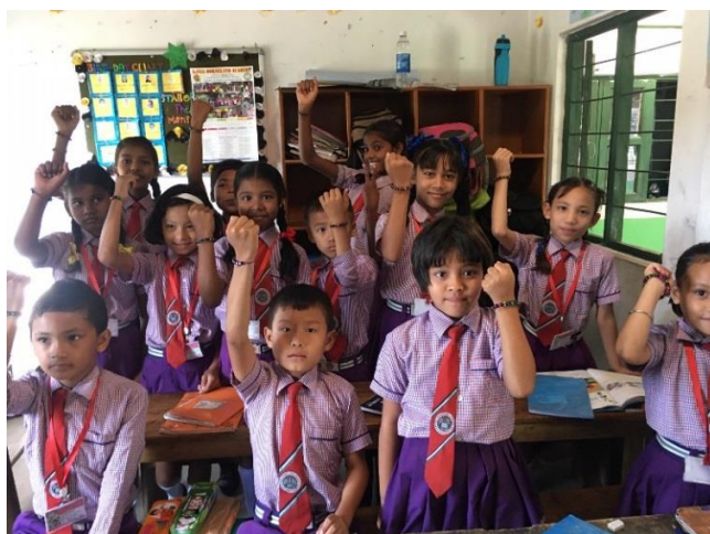
Pyssel med pärlband av bokstäver