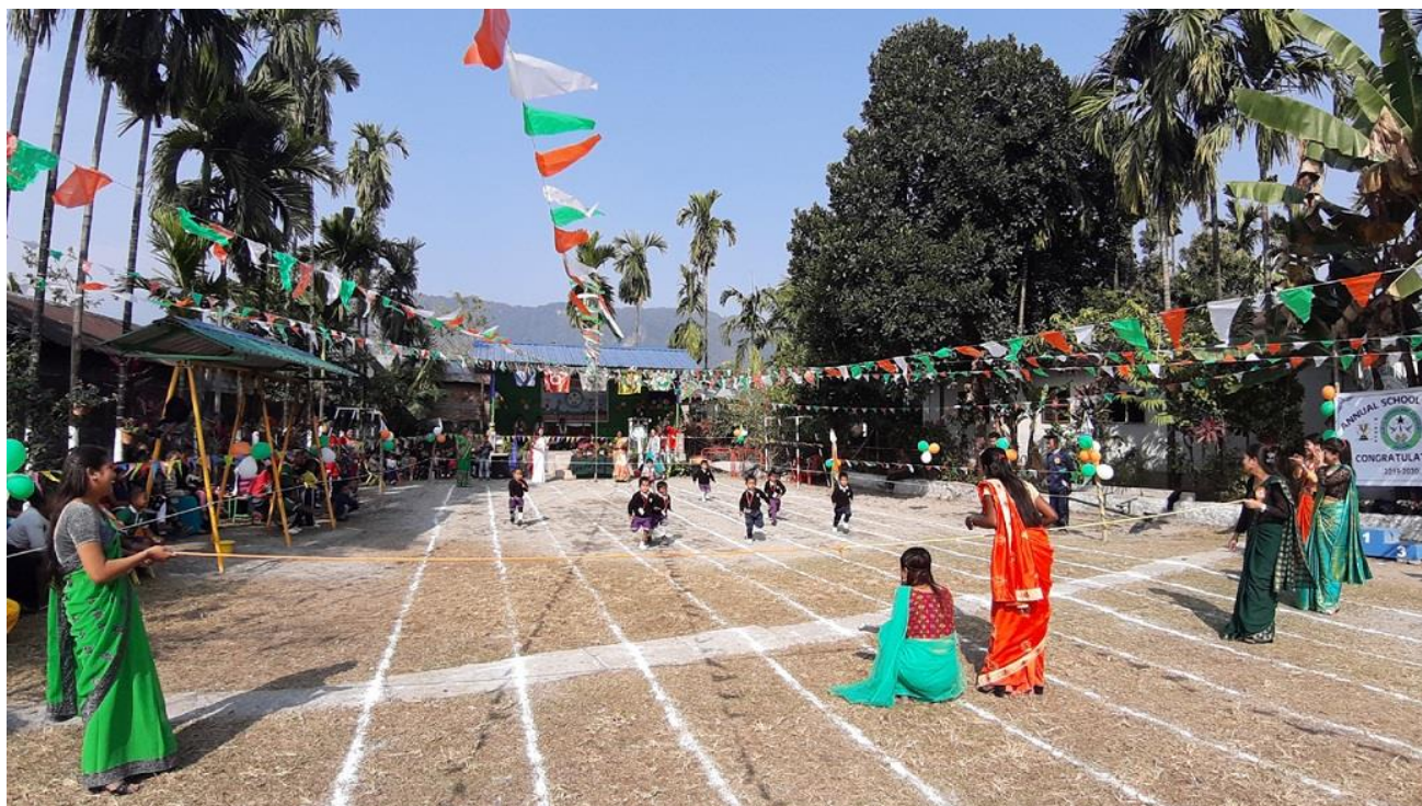
De yngsta eleverna hejas här fram till mållinjen under skoltävling

Kontakta Swed-Asia Travels i Strängnäs! Ring 0152-181 82, eller mejla till reslust@swedasia.com