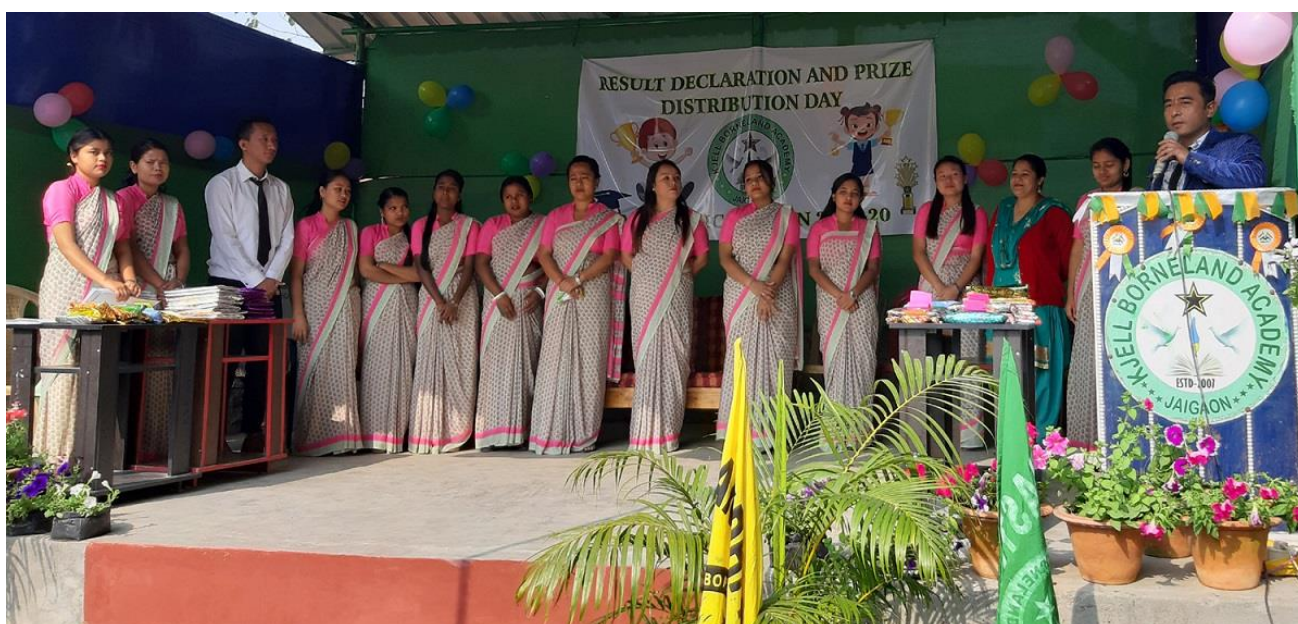
Skolans lärare i bild

Tack för att du är med och stödjer eleverna på "Kjell Borneland Academy" - En skola i det fattiga området Chota Mechia Busty nära staden Jaigaon, Jalpaiguri i delstaten Västbengalen.