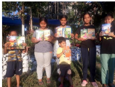
litteratur till skolbiblioteket